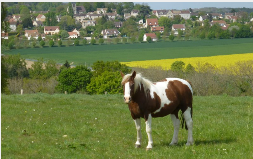
Vue sur Lainville-en-Vexin (PNRVF)