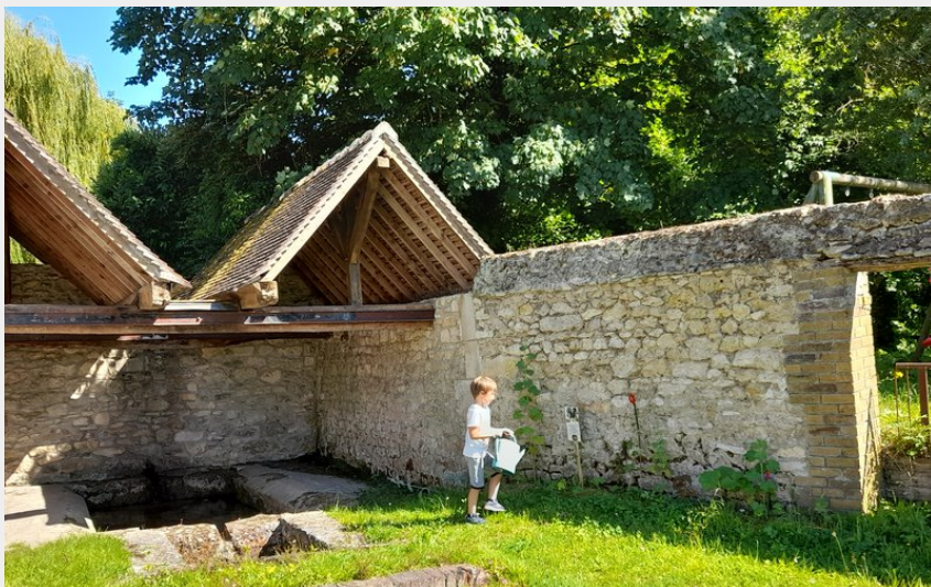
Lavoir Sainte Barbe