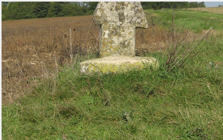
Croix des friches (PNRVF)