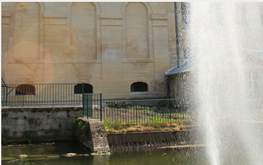
Pavillon Jacques de Manse (PNROPF)