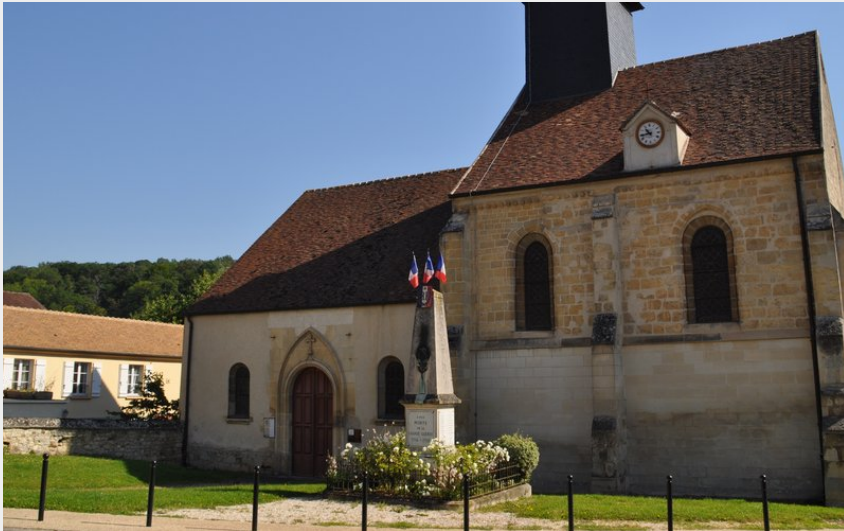
Eglise St-Quentin (PNRVF)