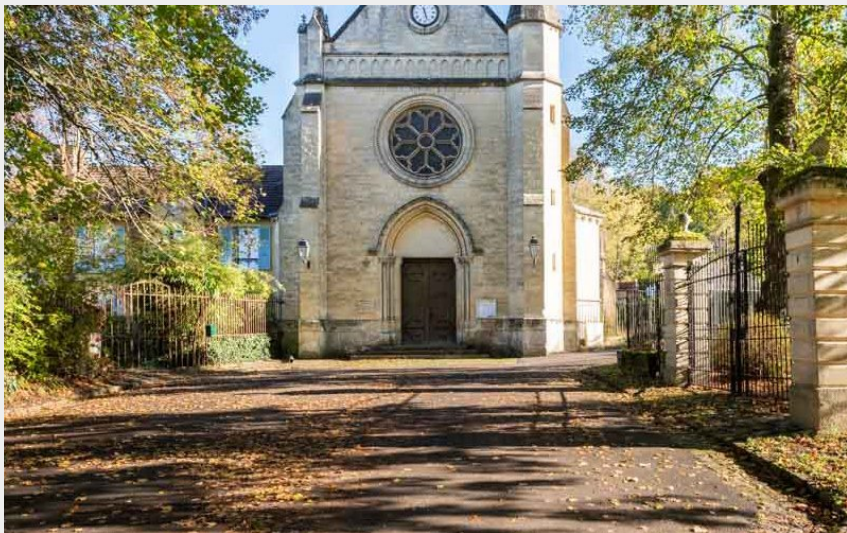
Eglise Nointel (Cyril Badet)