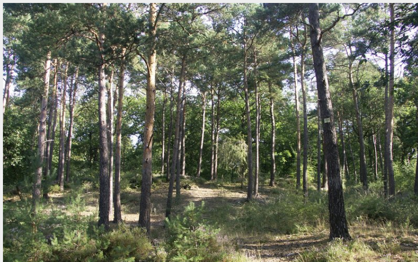
Forêt d'Ermenonville (PNROPF)