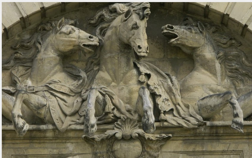
Sculpture équestre (PNROPF)