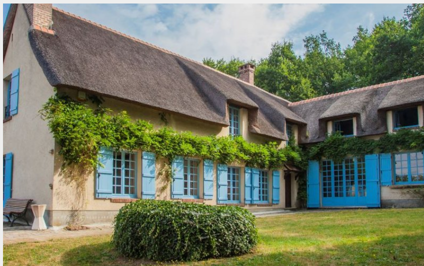
Maison Jean Monnet (PNRHVC)