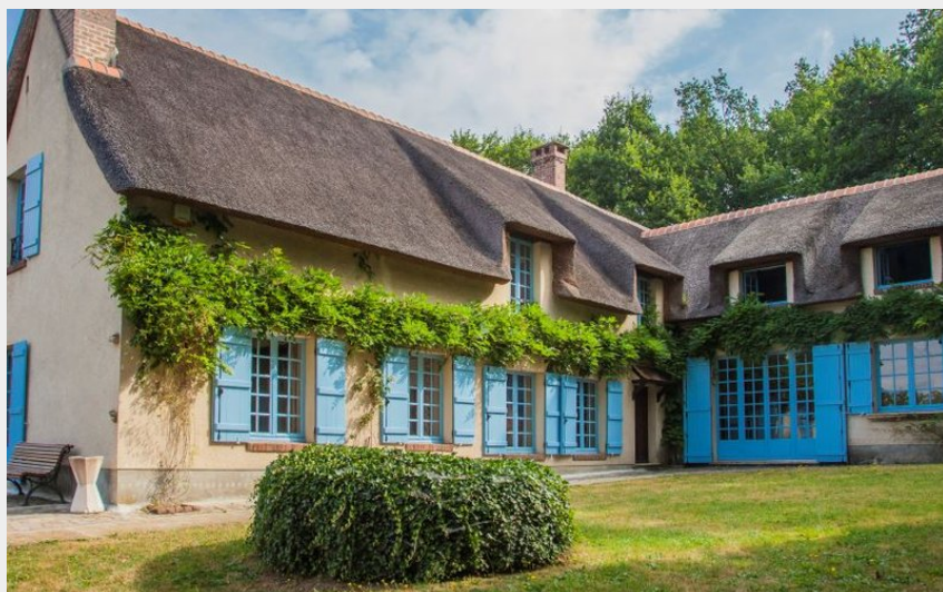
Maison Jean Monnet