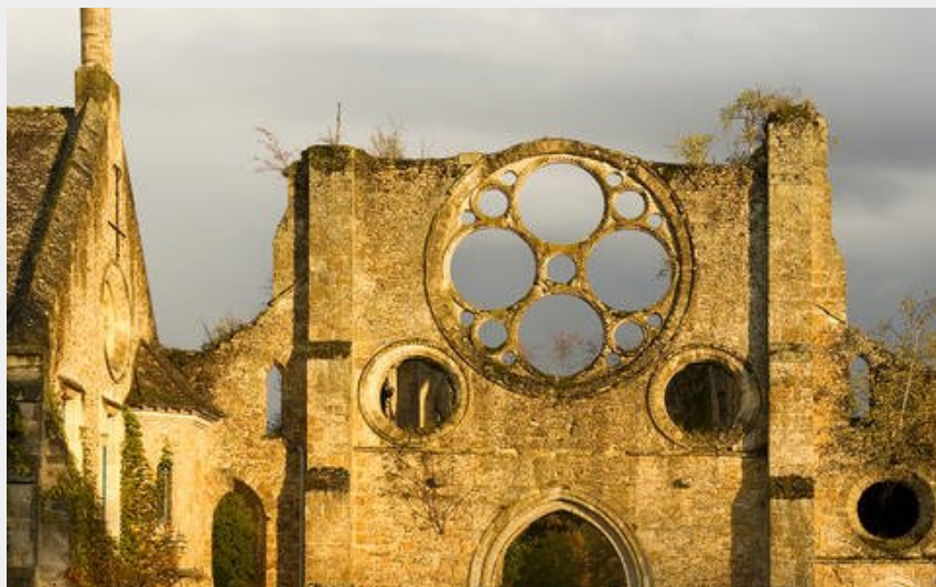
Abbaye des Vaux de Cernay (PNRHVC)