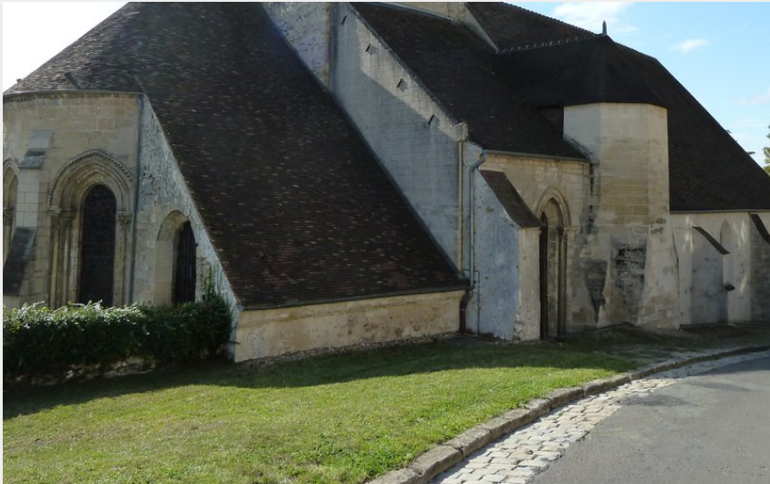
Eglise de Vaux-sur-Seine (PNRVF)