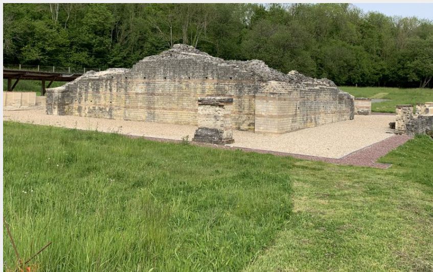
Le site archéologique de Genainville (PNRVF)