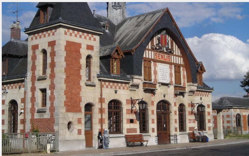
L'ancienne gare de Senlis (PNROPF)